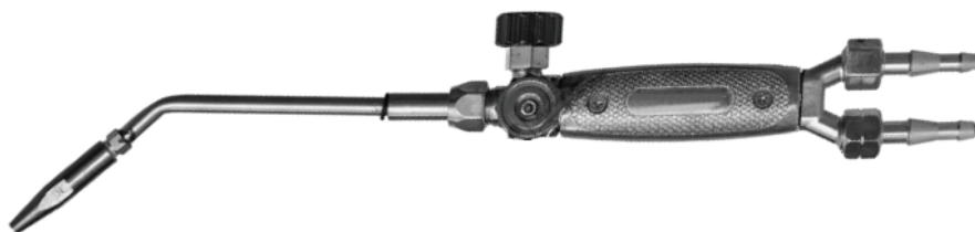
Рис.1- Общий вид горелки

Горелка состоит из ствола и комплекта наконечников. Ствол горелки имеет регулировочные вентили кислорода и пропан-бутана. К стволу по резиновым рукавам